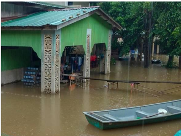
Sebahagian penduduk Kampung Terusan, Pasir Mas, membina titi bagi menghubungkan kediaman mereka ke jalan utama sebagai langkah persediaan awal menghadapi musim tengkujuh.

KUALA LUMPUR: Mangsa banjir di seluruh negara berkurang kepada 481 orang daripada 116 keluarga di enam negeri setakat jam 6 pagi, pada Ahad. Menurut info banjir Jabatan Kebajikan Masyarakat (JKM), antara negeri terjejas adalah Melaka, Terengganu, Kelantan, Sarawak, Johor dan Selangor.