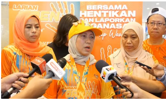
Datuk Seri Nancy Shukri

Menteri Pembangunan Wanita, Keluarga dan Masyarakat