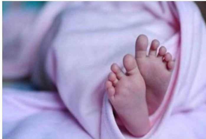
Kadar Kesuburan Jumlah (TFR) di Malaysia dilaporkan menunjukkan penurunan sejak tahun 2013.

KADAR Kesuburan Jumlah (TFR) di Malaysia dilaporkan menunjukkan penurunan sejak tahun 2013, seperti yang dimaklumkan oleh Menteri Pembangunan Wanita, Keluarga dan Masyarakat, Datuk Seri Nancy Shukri di Dewan Rakyat baru-baru ini.