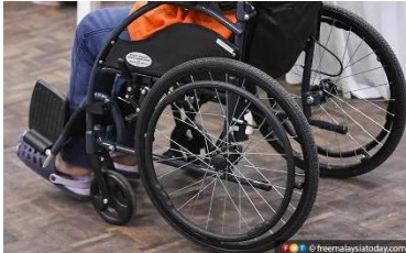
From 164 parents and professionals from the National Family Support Group for Children and People with Special Needs

Letter to the Editor - 24 Feb 2025, 09:07 AM Supporting adults with diverse disabilities for dignified living.