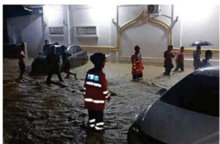
Antara kawasan terjejas banjir di Sandakan.

Di Sandakan, dua PPS dibuka di Masjid Nur Iman dan Masjid Nur Hidayah manakala di Beluran pula, PPS dibuka di Dewan Kampung Sungai Nangka dan Dewan Kampung Balaban.