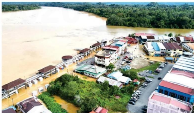
Floodwaters inundate a section of Kanowit town after the Rajang River burst its banks.