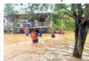
House call: Civil Defence Force personnel checking on the occupants of a house in Kota Marudu following continuous heavy rain.