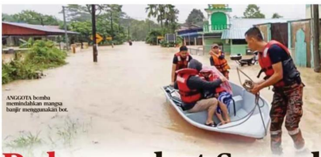
ANGGOTA bomba memindahkan mangsa banjir menggunakan bot.