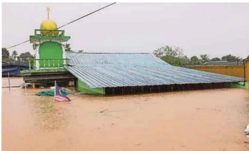
Al-Hijrah Surau in Kampung Pasir Tebrau near Johor Baru is submerged yesterday after non-stop rain since Wednesday.

The Malaysian Meteorological Department has issued a severe continuous rain warning for Johor Baru, Kluang, Mersing, Pontian, Kulai and Kota Tinggi until today.