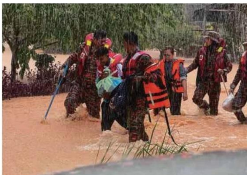
Pasukan bomba membantu penduduk berpindah susulan banjir yang semakin memburuk di Kampung Sentosa Damai, Pasir Gudang pagi semalam.