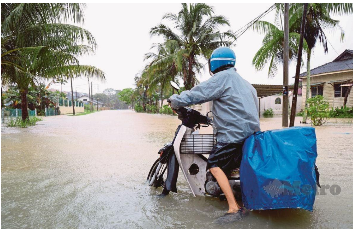
KEADAAN banjir di Kampung Mohd Amin, Johor Bahru.

Johor Bahru: Jumlah mangsa banjir di Johor naik mendadak daripada 1,691 orang petang tadi, kepada 3,694 orang membabitkan 917 keluarga.