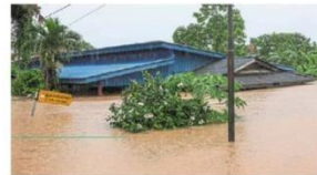
Waterworld: Floodwater rising almost to the roof of some houses in Kampung Pasir Tebrau.

This year's celebrations likely to be a sombre affair for Johor victims