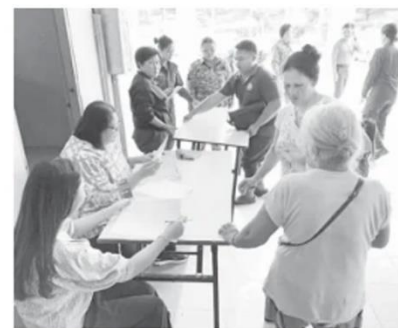
MANGSA BANJIR: Pihak berkuasa membantu dalam proses pendaftaran mangsa banjir yang dipindahkan ke PPS di Dewan Masyarakat Song, semalam.

Penduduk yang memerlukan bantuan kecemasan boleh menghubungi MERS 999 atau Pusat Kawalan Operasi Daerah (PKOD) Song di talian 017-9404948.