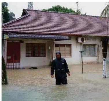
Penduduk meredah air banjir di Kampung Mohd Amin, Johor Bahru, semalam.