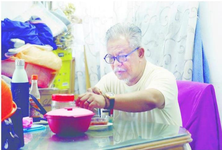
The Social Welfare Department's primary goal is to help seniors age within their communities rather than in institutional care.

PETALING JAYA: The growing number of elderly and infirm Malaysians living alone, and in some cases dying unnoticed, has prompted the Social Welfare Department to intensify its efforts to safeguard such individuals and ensure they remain connected within the community.