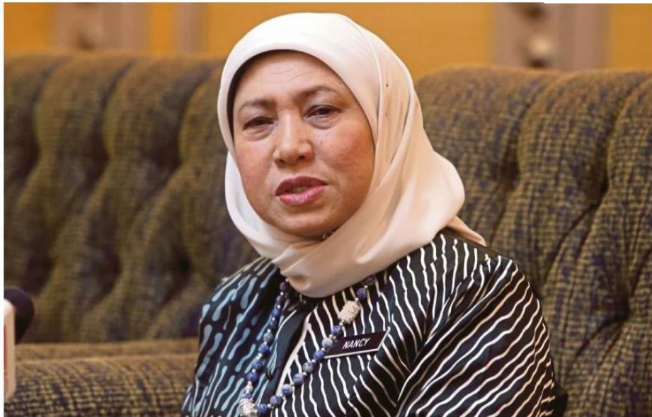
Datuk Seri Nancy Shukri.

KUALA LUMPUR: Kementerian Pembangunan Wanita, Keluarga dan Masyarakat (KPWK) menerusi Jabatan Pembangunan Wanita (JPW) telah melaksanakan 734 program bagi membantu wanita dalam aktiviti ekonomi di seluruh negara sepanjang tahun lalu.