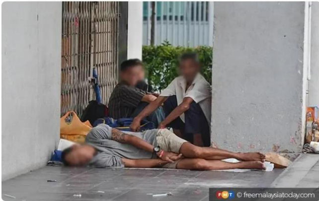
People from other states don't mind being homeless in Kuala Lumpur because of shelters and meals from charities, says an NGO leader.

Yayasan Chow Kit says Finland provides permanent housing to the homeless without the need to be 'housing ready'.