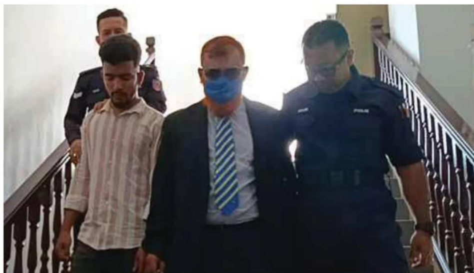
MIAH (kiri) didenda RM2,000 atas kesalah mencederakan dan mengurung wanita OKU.

Bagi pertuduhan kedua, dia didakwa secara salah mengurung mangsa sama di tempat, masa dan pada tarikh sama.