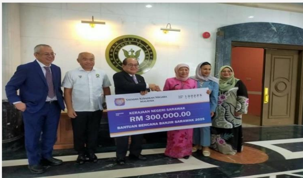
Majlis Penyerahan Bantuan Bencana Banjir Sarawak 2025 di Wisma Bapa Malaysia, Kuching

Nasional - Dicipta: 13 Februari 2025 12:19 PM - Kemas kini: 13 Februari 2025 12:19 PM