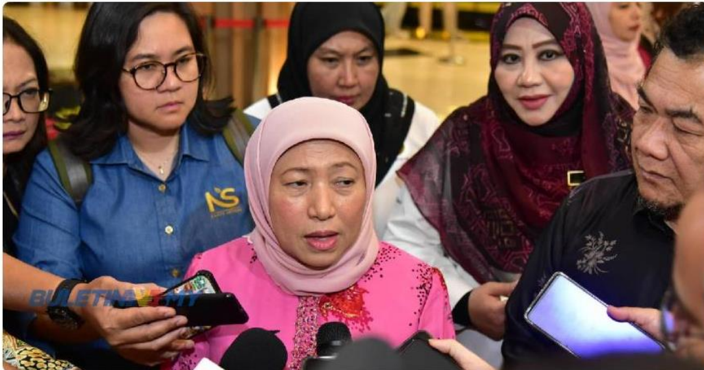
Semua kanak-kanak itu akan menjalani sesi persekolahan seperti kanak-kanak lain yang berada di bawah jagaan JKM.