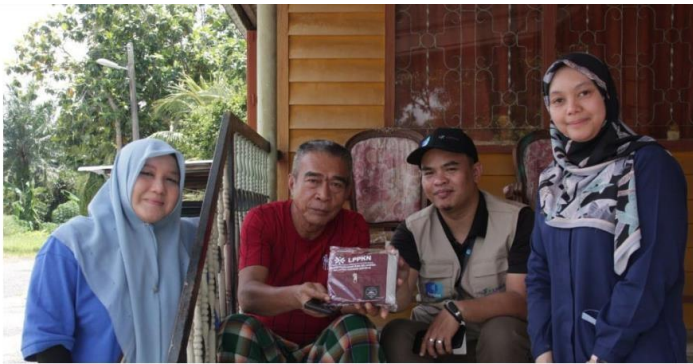
Penemu bual bersama penghuni isi rumah terpilih ketika kerja lapangan.