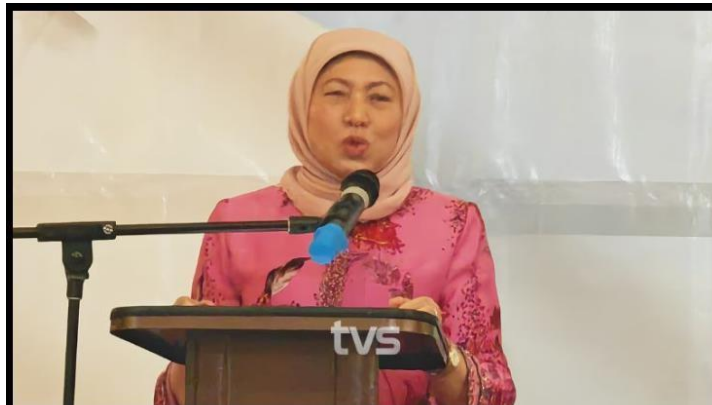
Menteri Pembangunan Wanita, Keluarga dan Masyarakat, Datuk Seri Nancy Shukri dalam ucapannya menekankan kepentingan penyampaian peruntukan yang efektif bagi memastikan kesejahteraan masyarakat di Parlimen Santubong melalui program Sej@ti MADANI.