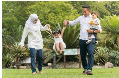
Kebahagiaan seorang ibu dan isteri berupaya membentuk sebuah keluarga yang positif. — Gambar hiasan

Talian itu memberi sokongan, maklumat dan bantuan segera kepada individu yang terlibat dalam situasi keganasan rumah tangga, selain menyediakan kaunseling dan panduan bagi mangsa memerlukan.