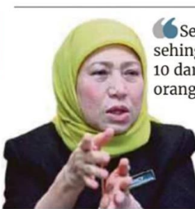
Nancy Shukri, Menteri Pembangunan Keluarga dan Masyarakat

Nancy berkata, secara keseluruhan sehingga kini hanya tinggal 10 daripada keseluruhan 560 orang kanak-kanak yang masih berada di bawah perlindungan JKM.