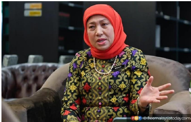
Nancy Shukri berkata wanita perlu digalakkan merebut peluang di luar tempat kerja tradisional, termasuk kerja dari jauh dan pilihan pekerjaan fleksibel.

PETALING JAYA: Akta Antigangguan Seksual 2022 memberi lebih keyakinan dan keselamatan kepada wanita di tempat kerja, kata Menteri Pembangunan Wanita, Keluarga dan Masyarakat, Nancy Shukri.