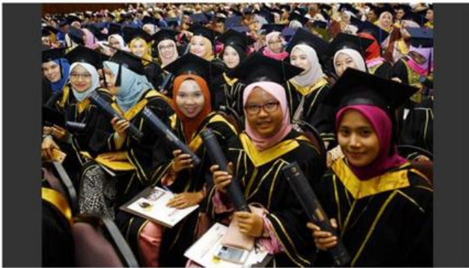
Pada tahun 2023, gaji median bulanan bagi graduan lelaki ialah RM4,800, berbanding RM4,350 bagi graduan wanita.

KUALA LUMPUR: Wanita di Malaysia menerima gaji yang lebih rendah berbanding lelaki dan lebih membimbangkan apabila jurang ini semakin melebar.