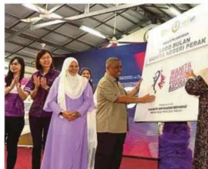
Menteri Besar Perak, Datuk Seri Saarani Mohamad merasmikan program Sambutan Hari Wanita Peringkat Perak 2025 di Laman Seri Ridzuan, Ipoh, semalam.