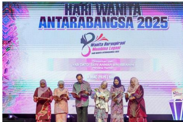
Perdana Menteri, Datuk Seri Anwar Ibrahim (tiga, kiri) melihat buku Dasar Wanita Negara yang dilancarkan pada Sambutan Hari Wanita Antarabangsa 2025 di Dewan Merdeka Pusat Dagangan Dunia (WTC) hari ini.

KUALA LUMPUR: Dasar Wanita Negara 2025-2030 yang dilancarkan hari ini, bertujuan memperhalusi dan menambah baik dasar sedia ada serta memperkuh lagi langkah penguatkuasaan terhadap pelaku keganasan rumah tangga.