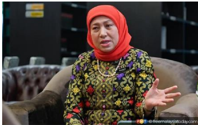
Nancy Shukri mahu pemimpin muda khususnya wanita mengambil alih kepimpinan masa kini supaya mereka dapat memberi motivasi dan inspirasi kepada generasi akan datang.

Nancy Shukri menyatakan Program Perantisan Kepimpinan Wanita oleh kementerianannya bertujuan membimbing usahawan dan pembuat keputusan pada masa depan.