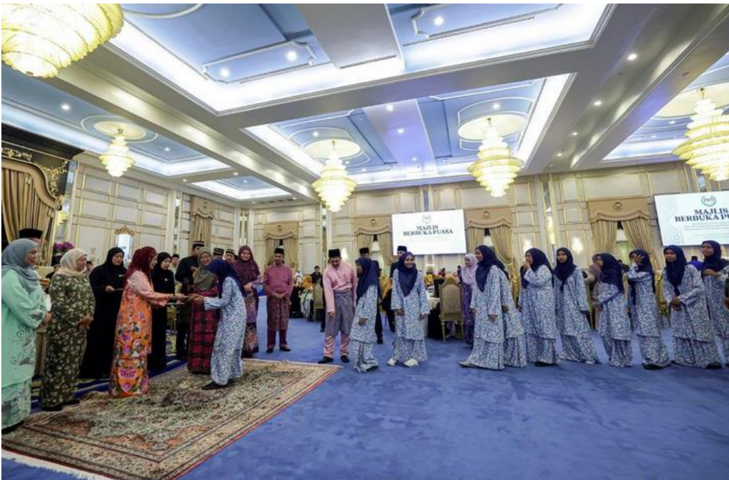
RAJA Zarith Sofiah berkenan menyampaikan sumbangan daripada Yayasan Raja Zarith Sofiah Negeri Johor kepada ibu tunggal dan anak yatim di Istana Negara hari ini.

Kuala Lumpur: Raja Permaisuri Agong Raja Zarith Sofiah berkenan berangkat ke majlis berbuka puasa bersama ibu tunggal dan anak-anak yatim di Istana Negara malam ini.