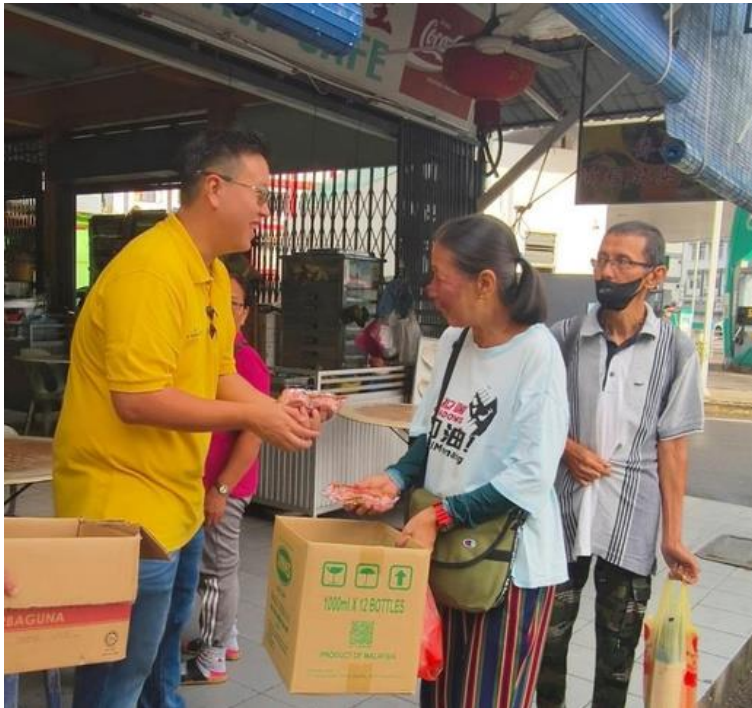
Lau (kiri) mengedarkan kek kepada salah seorang wanita di kawasan bandar Sibu sempena Hari Wanita Antarabangsa.

SIBU: Parti Rakyat Bersatu Sarawak (SUPP) Cawangan Bawang Assan mengedarkan 300 pekete kepada golongan wanita di kawasan bandar sempena sambutan Hari Wanita Antarabangsa hari ini.