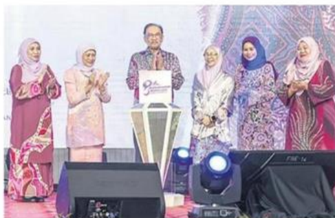
PELANCARAN: PM Anwar (tiga kiri) melancarkan Dasar Wanita Negara pada Sambutan Hari Wanita Antarabangsa 2025 di Dewan Merdeka Pusat Dagangan Dunia (WTC), Kuala Lumpur semalam.

"Setiap kementerian, bicara soal perpaduan ada peranan wanita. Kena ada komunikasi, mesti beri ruang