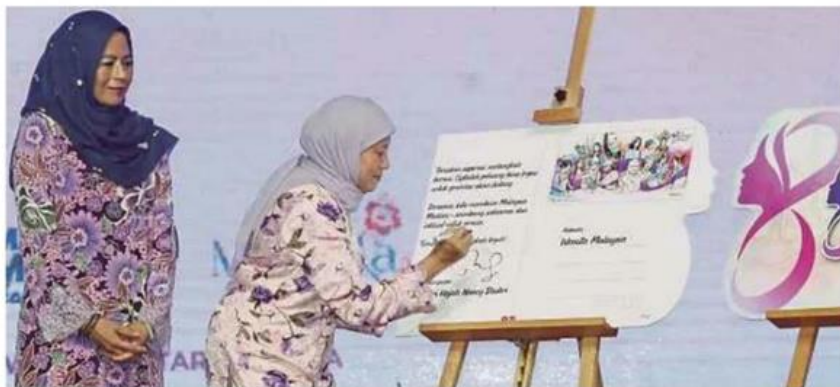
Women, Family and Community Development Minister Datuk Seri Nancy Shukri launching the ministry's International Women's Day stamp collection, in collaboration with Pos Malaysia Bhd, at World Trade Centre Kuala Lumpur yesterday. Present is her deputy, Datuk Seri Dr Noraini Ahmad.