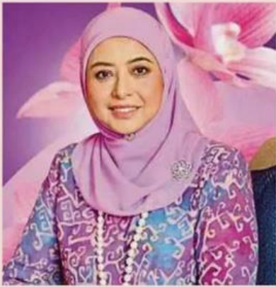
Her Majesty Raja Zarith Sofiah, Queen of Malaysia prays that every woman remains resilient and passionate in all her pursuits.

make them a source of inspiration, in building a meaningful legacy for future generations. "I also pray that every woman remains resilient and passionate in all her pursuits," she said in a post on the official Facebook page of His Majesty Sultan Ibrahim, King of Malaysia. Agencies