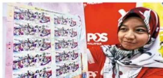
Making a mark: A Pos Malaysia Berhad staff member showing off the commemorative stamps in Kuala Lumpur.

The complete folder is available for RM38.10 and can be purchased at selected post offices nationwide or online via the Pos Malaysia website at www.pos.com.my/shop