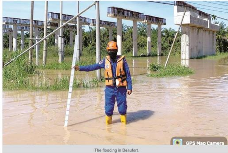
The flooding in Beaufort.

Published on: Saturday, March 08, 2025 By: Ahmad Apong