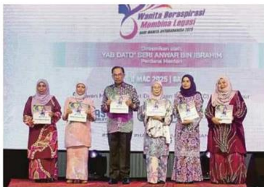
Prime Minister Datuk Seri Anwar Ibrahim launching the National Policy on Women at the International Women's Day celebration in Kuala Lumpur yesterday. Present are Women, Family and Community Development Minister Datuk Seri Nancy Shukri (second from left), her deputy Datuk Seri Noraini Ahmad (second from right) and Anwar's wife, former women's minister Datuk Seri Dr Wan Azizah Wan Ismail (third from right).