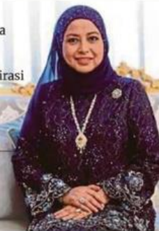
Raja Zarith Sofiah, Raja Permaisuri Agong

Kecekalan dan kebijaksanaan wanita dalam menghadapi cabaran menjadikan mereka sumber inspirasi dalam membina legasi bermakna untuk generasi akan datang