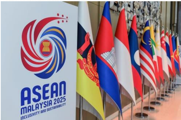
Malaysia must break free from bureaucratic inertia and transform the Asean 2025 Women's Economic Forum into a powerhouse of influence.

That movement was driven by passion, dedication, and a genuine concern for women's issues.