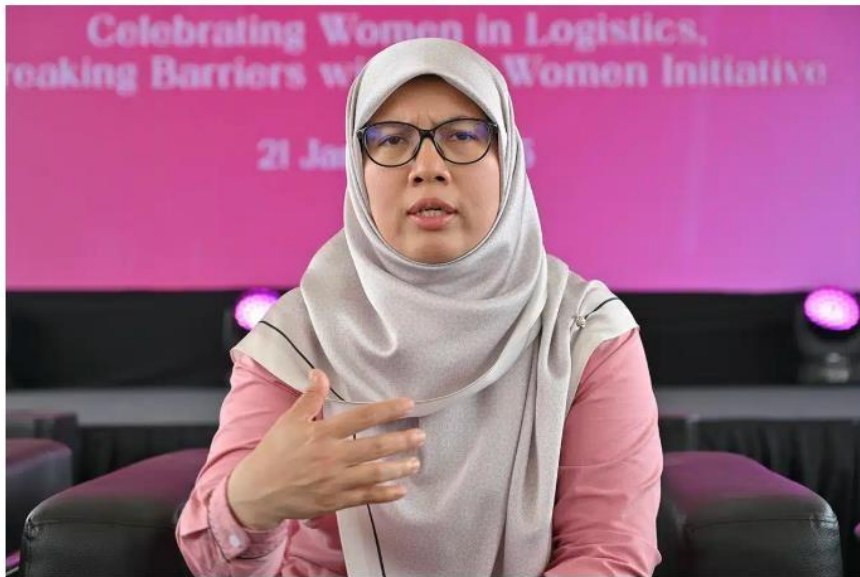
EXCO Pembangunan Wanita dan Kebajikan Masyarakat YB Anfaal Saari bercakap pada media selepas Majlis Perasmian Swift EmpowerHER Program di Pelabuhan Klang Selangor pada 21 Januari 2025.