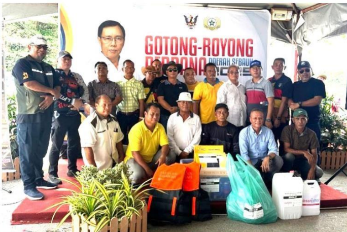
Ketua-ketua isi rumah yang menerima sumbangan merakam gambar bersama.