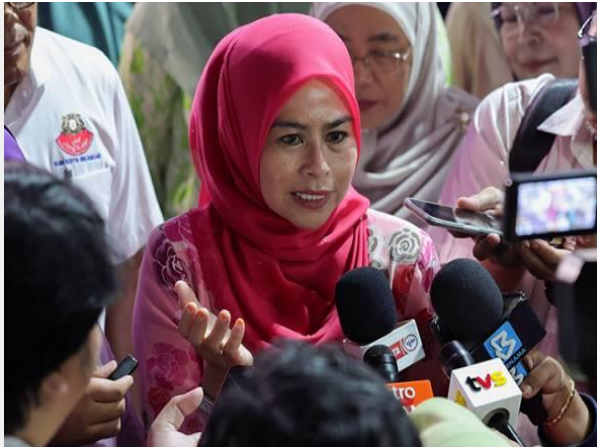
Noraini ketika ditemui pemberita selepas hadir Majlis Konvensyen Pemerkasaan Wanita, Keluarga & Masyarakat Peringkat Negeri Johor 2024 di Kompleks Sukan Educity pada Selasa.

ISKANDAR PUTERI: Kementerian Pembangunan Wanita, Keluarga dan Masyarakat (KPWK) akan terus memberikan fokus terhadap isu keganasan rumah tangga, kata Timbalan Menteri berkaitan Datuk Seri Noraini Ahmad.