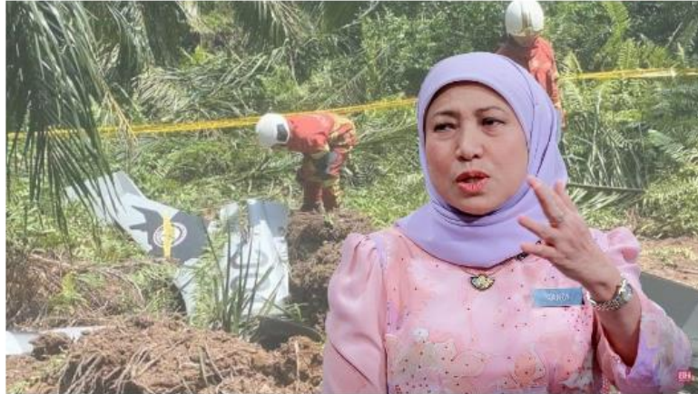
Menteri Pembangunan Wanita, Keluarga dan Masyarakat, Datuk Seri Nancy Shukri, berkata pegawai JKM bertindak segera untuk memberikan perkhidmatan sebaik saja mengetahui mengenai insiden pesawat ringan terhempas.

PUTRAJAYA: Jabatan Kebajikan Masyarakat (JKM) akan mengatur gerak pegawai bagi menyantuni dan memberikan sokongan psikologi kepada keluarga mangsa nahas pesawat ringan model BK 160 Gabriel yang terhempas di Kampung Tok Muda di Kapar, Klang, semalam.