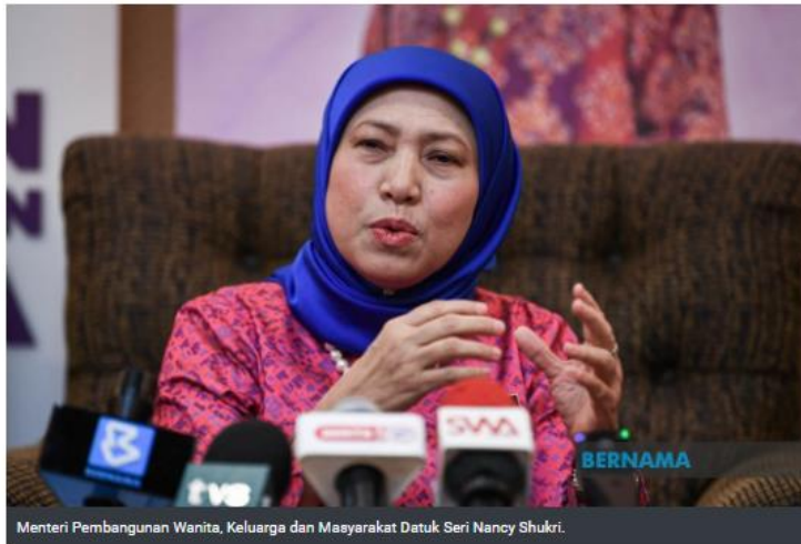
Menteri Pembangunan Wanita, Keluarga dan Masyarakat Datuk Seri Nancy Shukri.