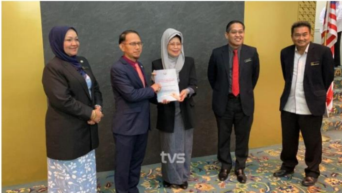
Dato Sri Fatimah Abdullah menyerahkan naskah Penyelidikan Profil Kehamilan Remaja di Sarawak 2021 semasa sidang media Mesyuarat Majlis Pembangunan Sosial di Kuching, hari ini.