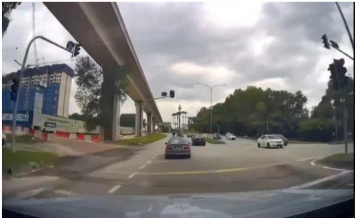
POLIS sedang mengesan penjaga dua kanak-kanak tular mengeluarkan kepala dari sebuah kereta yang sedang bergerak di Putra Height, Subang Jaya.

Subang Jaya: Polis akan memanggil pemilik kenderaan yang cuai dengan membenarkan dua kanak-kanak mengeluarkan kepala menerusi bumbung kaca atau sunroof sebuah kenderaan yang sedang bergerak dipercayai di Persiaran Putra Perdana, Putra Height di sini, kelmarin.