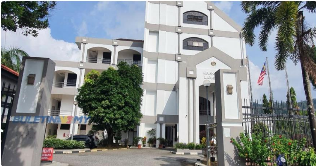
Kompleks Mahkamah Langkawi.

LANGKAWI: Seorang bapa dihukum penjara lima tahun oleh Mahkamah Sesyen hari ini selepas mengaku bersalah mendera anak perempuannya yang berusia 16 tahun, Jun lalu.