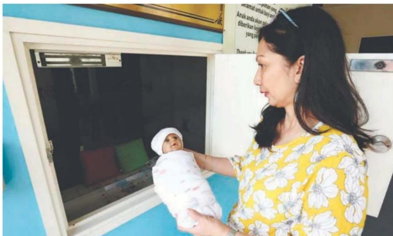
A baby hatch initiative by the OrphanCare Foundation saved 85 babies this year.

“Islam encourages starting this education before children reach sexual maturity. By empowering children and teens to protect themselves from risks, sex education becomes a vital tool for their safety and wellbeing.”