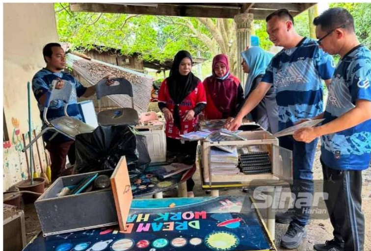
Barangan tabika dan taska Kemas rosak akibat banjir hingga ke bumbung premis.

TUMPAT - Sebanyak 180 premis Taman Bimbingan Kanak-kanak (tabika) dan Taman Asuhan Kanak-kanak (taska) milik Jabatan Kemajuan Masyarakat (Kemas) di negeri ini terjejas akibat ditenggelami banjir gelombang pertama, bulan lalu.