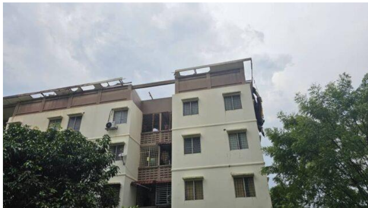
Beberapa buah unit kediaman di Pangsapuri Angsana Bandar Bukit Puchong 2, Jalan Pulau Meranti, Sepang mengalami kerosakan bumbung akibat diterbangkan ribut pada 8 April 2023.

Terdahulu petang semalam Aiman Athirah telah melawat lokasi bencana ribut di pangsapuri Angsana, Bandar Bukit Puchong yang merupakan antara tempat yang paling terkesan dalam kejadian itu.