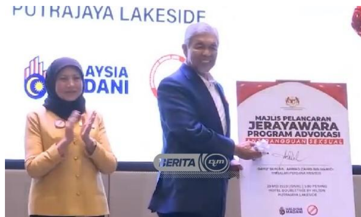
(Ahmad Zahid Hamidi (kanan) dan Nancy Shukri (kiri) melancarkan Jerayawara Advokasi Antigangguan Seksual di Putrajaya)

Beliau berkata, kementeriannya melalui Jabatan Pembangunan Wanita akan melaksanakan program itu di premis awam dan tempat kerja di peringkat komuniti sepanjang 2023 di seluruh negara