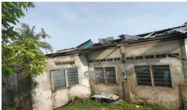
(Tinjauan media di Kuala Perlis dan Simpang Empat mendapati 14 kawasan dikenal pasti terlibat sekitar Arau dan Kangar)

Bagi membersihkan rumah yang dihempap pokok, Angkatan Pertahanan Awam (APM) turut menggerakkan anggota ke kawasan terjejas bagi memotong dan mengalih pokok tumbang.