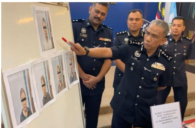
Kesemua suspek direman sehingga esok.

“Kesemua suspek direman sehingga esok bagi membantu siasatan mengikut Seksyen 420 Kanun Keseksan iaitu menipu.