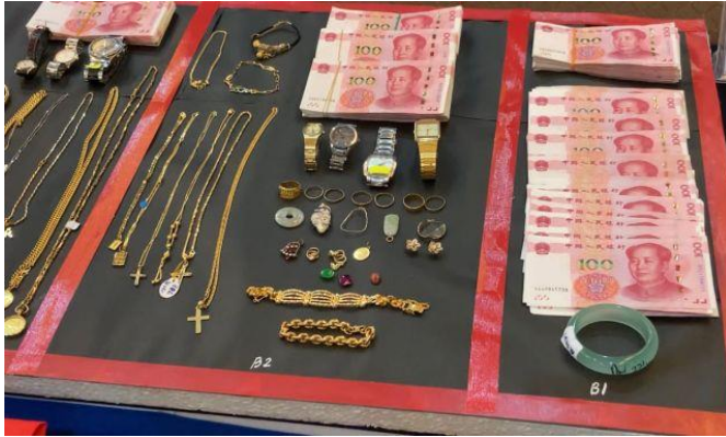
Antara barang rampasan.

Tambah Fisol, sebaik bungkusan itu dibuka di rumah, baru mangsa sedar dirinya diperdayakan apabila ia hanya mengandungi botol air minuman dan batu bata.