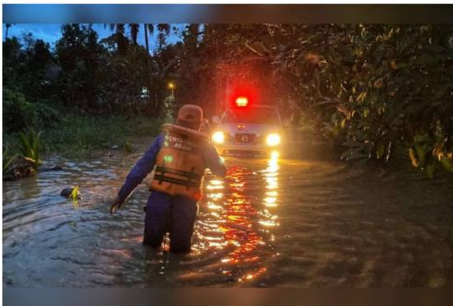
Keadaan banjir di Raub menyaksikan 10 PPS Isnin dibuka dan tiga lagi di Lipis pada Isnin.

PPS Rumah Pertanian Kampung Pamah Rawas menempatkan jumlah mangsa tertinggi di Raub iaitu 107 orang.