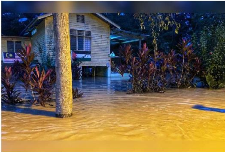
Keadaan banjir di Raub menyaksikan jumlah mangsa terus bertambah setakat ini.

KUANTAN - Daerah Raub dan Lipis terus mencatatkan peningkatan jumlah mangsa banjir yang ditempatkan di 13 pusat pemindahan sementara (PPS) pada Isnin.