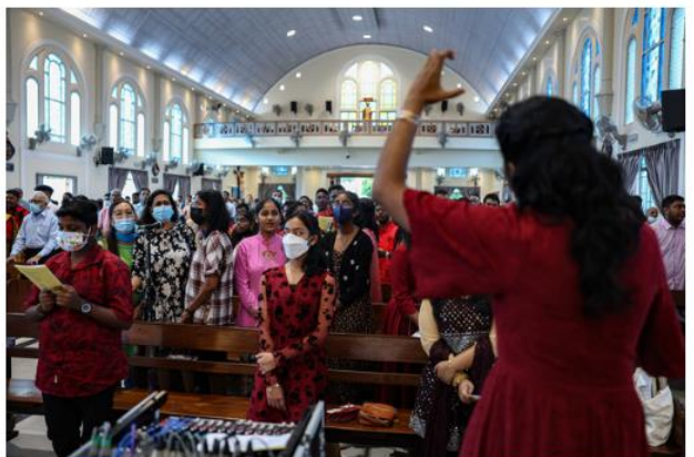
Penganut Kristian mengikuti upacara keagamaan pada sambutan Hari Krismas ketika tinjauan Bernama di Church of Our Lady of Lourdes, hari ini.

Menteri Pengangkutan Anthony Loke dalam ucapan Hari Krismas menerusi hantaran di laman Facebook berkata pertemuan semula dengan orang tersayang pada musim perayaan dapat mengeratkan ikatan kekeluargaan, kemasyarakatan dan negara.