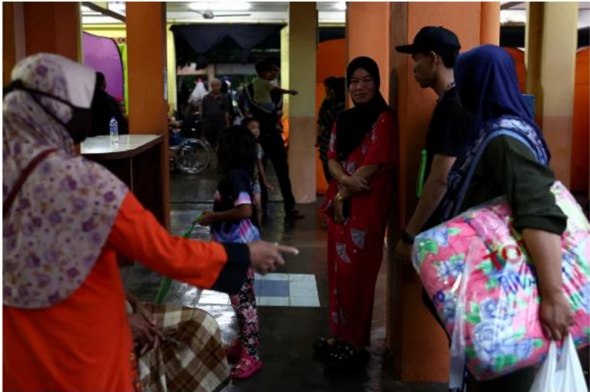
Mangsa banjir di Pasir Mas meningkat kepada 6,261 orang malam ini. Gambar PPS Sekolah Kebangsaan (SK) Gual Tinggi, Pasir Mas hari ini.

KOTA BHARU: Keadaan banjir di Kelantan semakin buruk dengan mangsa meningkat mendadak kepada 11,329 orang sehingga 10 malam ini, berbanding 5,155 petang tadi.