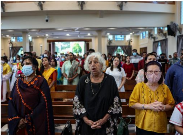
Penganut Kristian mengikuti upacara keagamaan pada sambutan Hari Krismas ketika tinjauan Bernama di Church of Our Lady of Lourdes, hari ini.

KUALA LUMPUR: Setiap perayaan diraikan rakyat pelbagai kaum di Malaysia perlu dijadikan sebagai teras perpaduan yang merupakan kunci utama kepada keharmonian kaum serta kesejahteraan rakyat dan negara.