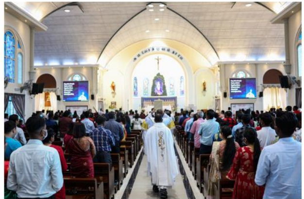
Penganut Kristian mengikuti upacara keagamaan pada sambutan Hari Krismas ketika tinjauan Bernama di Church of Our Lady of Lourdes, hari ini.

Menteri Komunikasi Fahmi Fadzil turut menzahirkan ucapan Hari Natal buat masyarakat beragama Kristian di seluruh negara dengan harapan agar perayaan tahun ini disambut dengan meriah bersama keluarga tercinta masing-masing.