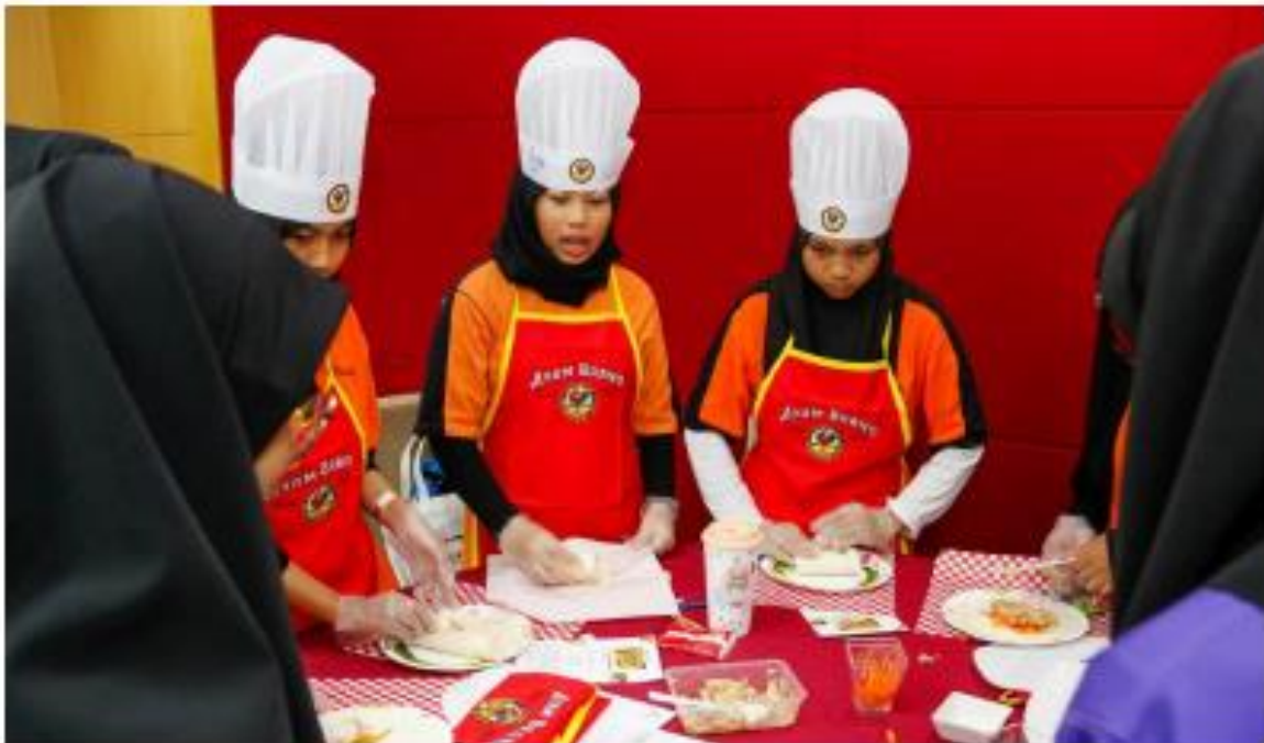
DIDIK kanak-kanak membuat pilihan makanan lebih sihat.

Dianggarkan sehingga 5.6 juta kanak-kanak Malaysia yang ke sekolah berdepan dengan masalah beban berganda malnutrisi.