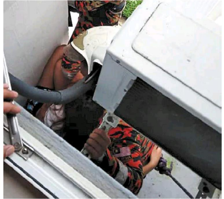
Daring operation: Firemen rescuing the woman at Sri Utama Condominium in Sandakan.

Those in need of someone to talk to can call Befrienders KL at 03-7956 8145, 04-281 5161/1108 in Penang, 05-547 7933/7955 in Ipoh, 08-825 5788, 016-803 6945 in Kota Kinabalu, or email sam@befrienders.org.my ; Mental Health Psychosocial Support Service (03-2935 9935 or 014-322 3392); Talian Kasih (15999 or 019-261 5999 on WhatsApp); and Jakim's Family, Social and Community care centre (011-1959 8214 on WhatsApp).