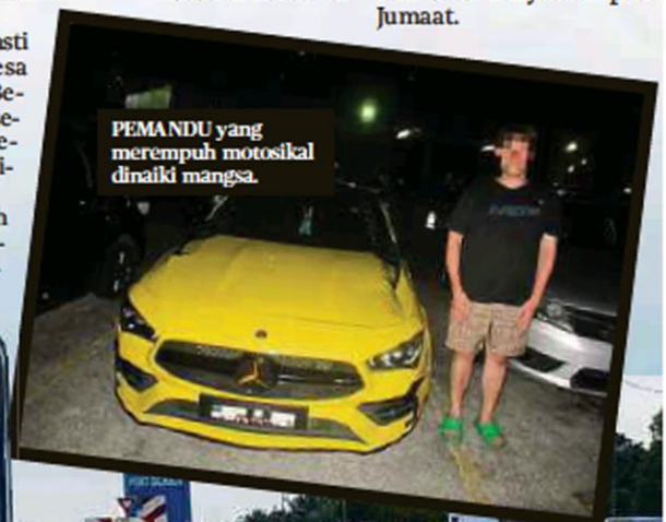
PEMANDU yang merempuh motosikal dinaiki mangsa.