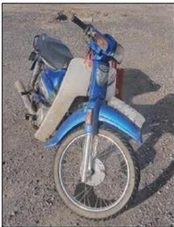
The motorcycle involved in the accident at Jalan Sri Aman-Sarikei.

By Jeremy Veno reporters@theborneopost.com