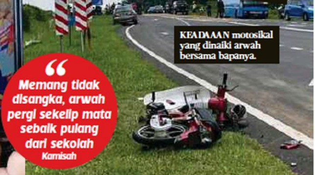
KEADAAAN motosikal yang dinaiki arwah bersama bapanya.