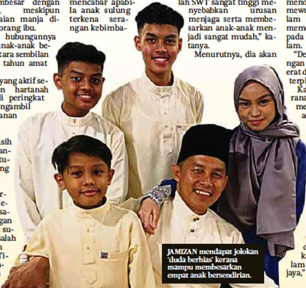
JAMIZAN mendapat jolokan 'duda berhias' kerana mampu membesarkan empat anak bersendirian.

"Tumpuan kini ada membesarkan anak dan mahu memastikan mereka berjaya dalam akademik serta kerjaya," katanya.