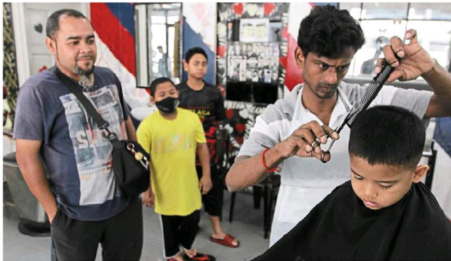
Essential service: Barbers, among other sectors, have faced worker shortages across the country.

"The memorandum addressed the issues related to the three sub-