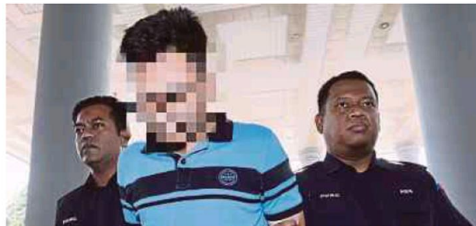
Seorang penganggur tidak mengaku bersalah bersubahat dalam kes rogol adik ipar di Mahkamah Sesyen, Kuala Lumpur, semalam.

Susulan pengakuan tidak bersalah itu, Timbalan Pendakwa Raya, Roslizi Sulaiman, tidak menawarkan sebarang jaminan terhadap tertuduh kerana bimbang akan mengganggu usaha menangkap suspek lain.