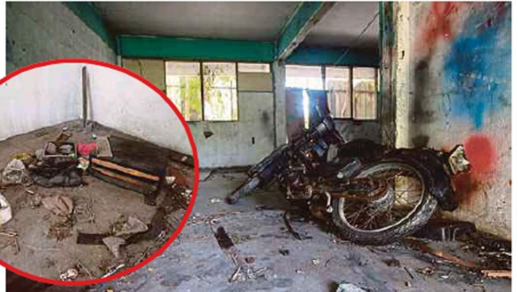
RUMAH pangsa PKNS yang terbiar kini jadi tempat sorok barang curi dan penagihan dadah.

Menurut beliau, 10 blok yang dimiliki oleh sebuah agensi kerajaan itu diabaikan tanpa penyelenggaraan sejak hampir 15 tahun dan ia membuatkan penduduk 'terseksa' dengan persekitaran yang terdedah dengan pelbagai kegiatan tidak sihat.