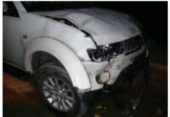
Keadaan motosikal dan kenderaan pacuan empat roda yang terbabit kemalangan di Serendah, kelmarin.