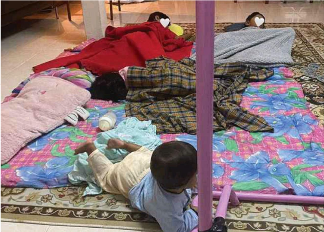
EMPAT beradik ditempatkan di rumah jiran buat sementara waktu selepas ditinggalkan ibu mereka di Ampangan, Seremban.