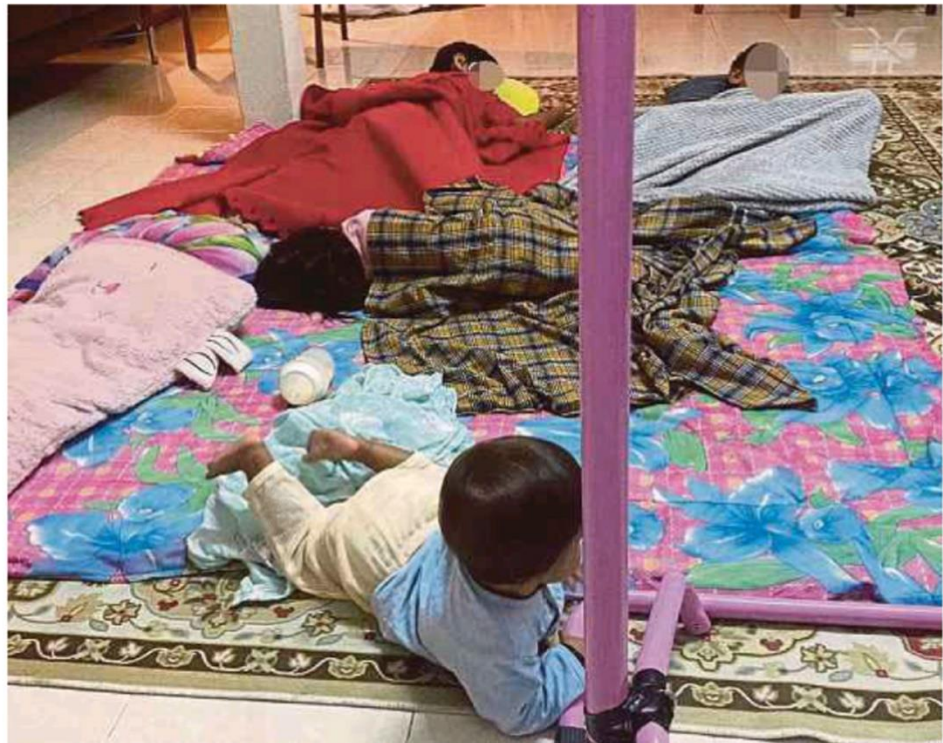
Empat beradik ditempatkan di kediaman jiran sementara menunggu kehadiran JKJ di Ampangan, Seremban, kelmarin.

"Penduduk mengambil mereka dan ditempatkan di kediaman jiran serta diberi makanan. Ketika JKJ mengambil mereka, empat beradik itu berada dalam keadaan baik," katanya ketika