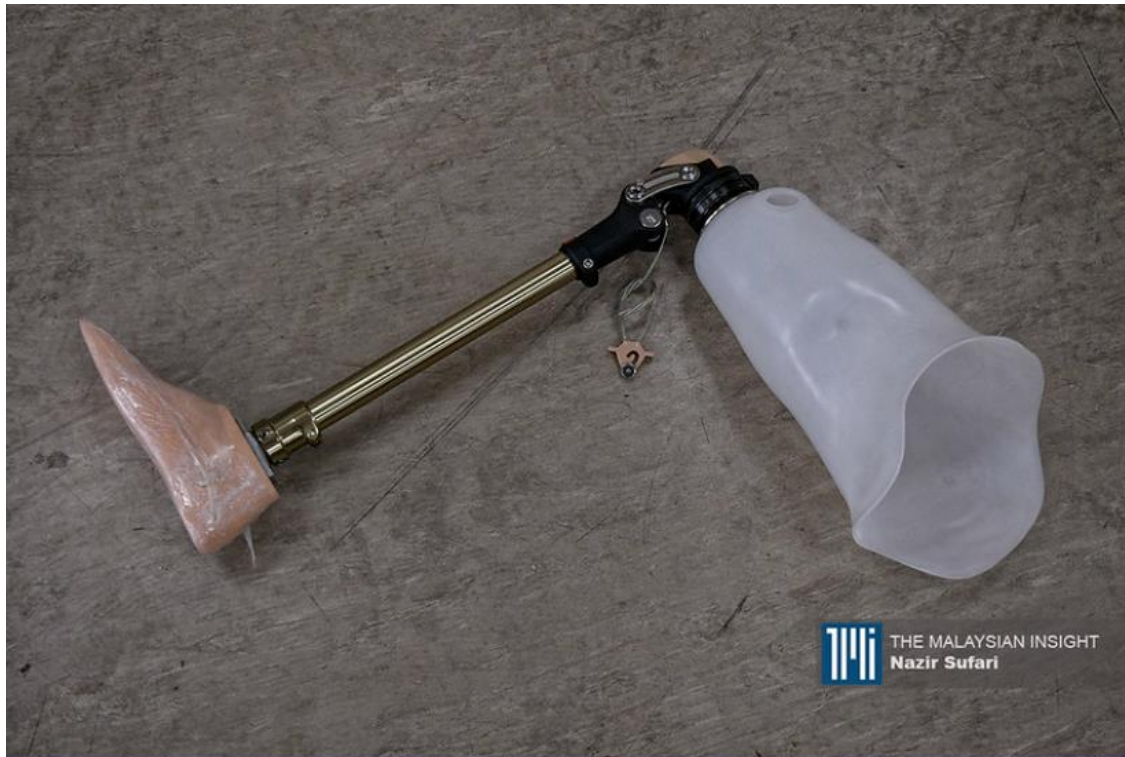
The Social Welfare Department is urged to boost efforts to reach out to handicapped folk living in the rural areas of the Sarawak. – The Malaysian Insight file pic, December 6, 2023.

Updated 9 hours ago · Published on 06 Dec 2023 1:00PM