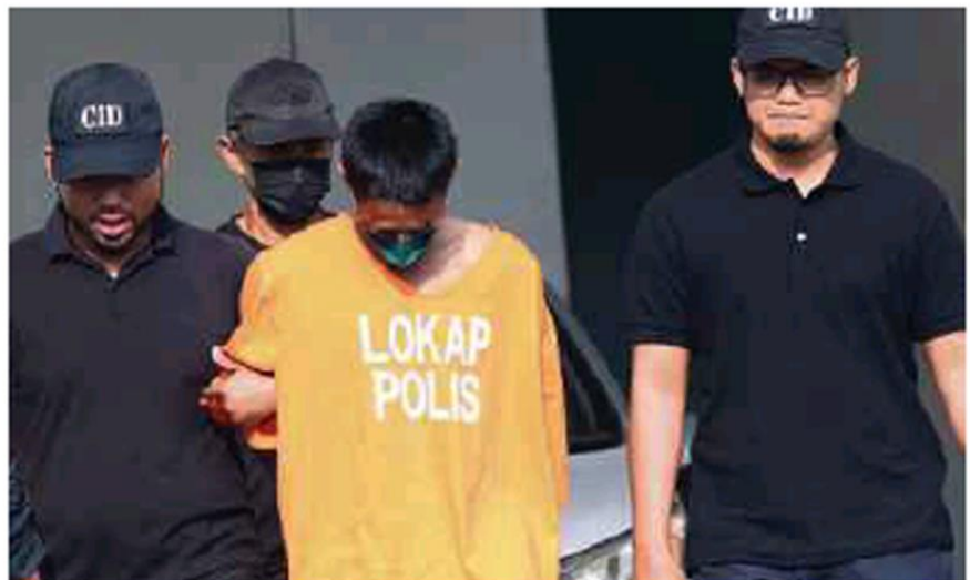
Pesara tentera dibawa ke Mahkamah Majistret Kangar, semalam.

Kelmarin, media melaporkan seorang lelaki ditahan kerana disyaki menikam mati isterinya yang berusia 31 tahun dengan sebilah pisau dalam kejadian pada kira-kira jam 6 pagi.