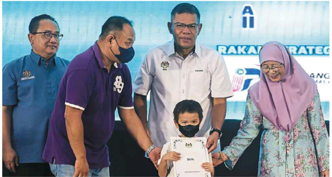
A place to call home: Saifuddin Nasution (third, left) presenting a certificate of citizenship to a child at the Home Affairs Ministry's Madani programme in Bandar Tun Razak, KL, with Dr Wan Azizah.

Saifuddin Nasution said the process to amend the Federal Constitution with regards to citizenship rights is going smoothly and is on schedule.