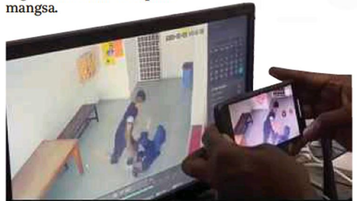
MANGSA cedera ditikam suspek menggunakan gunting.

“Kes disiasat mengikut Sekatan 324/393 Kanun Keseksaan,” katanya.